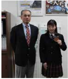
フェンシング部千葉穂波大会結果報告