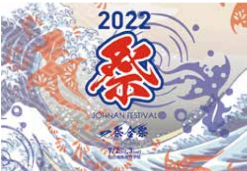
文化祭（一祭合祭ロゴ）

担うことが出来ました。このように少しずつではありますが、各種学校行事も少しずつ復活をきております。令和5年度は、新型コロナウイルス感染症が完全に収束し、通常通り各種大会やコンクール、学校行事が行われることを願っています。