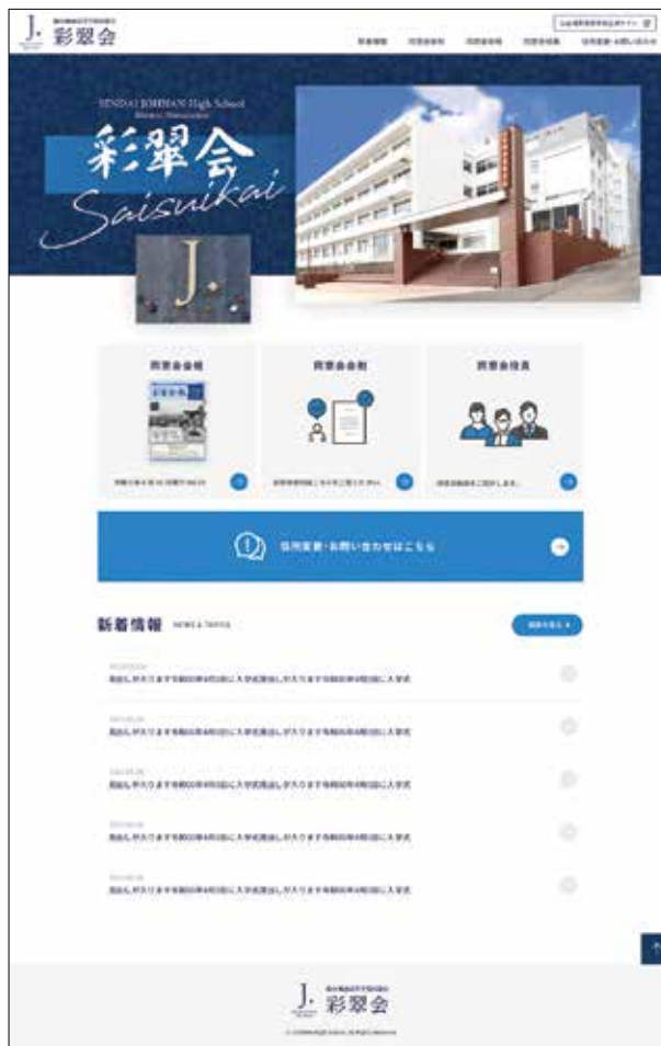
同窓会ホームページ TOP 画面のイメージ

〇仙台城南高校同窓会彩翠会の URL は https://saisuikai.net/