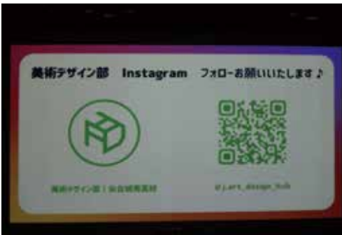
美術デザイン部文化部合同発表会

じく3年ぶりとなる文化祭「城南フェスティバル」も開催されました。他にも、生徒会総務委員会が昨年に引き続き八木山地区まちづくり研究会の「八木山イルミネーション・アートプロジェクト」に参加し、生徒会総務委員会が中心となって「城南イルミネーション again」を開催し、地域活性化の一翼を