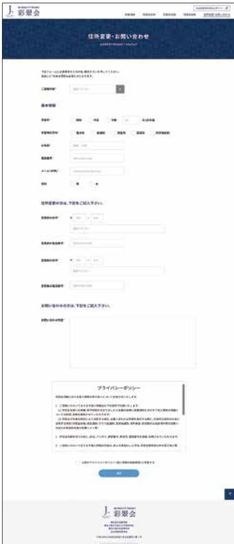
住所変更フォームイメージ