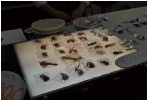
自然科学部文化祭出展作品